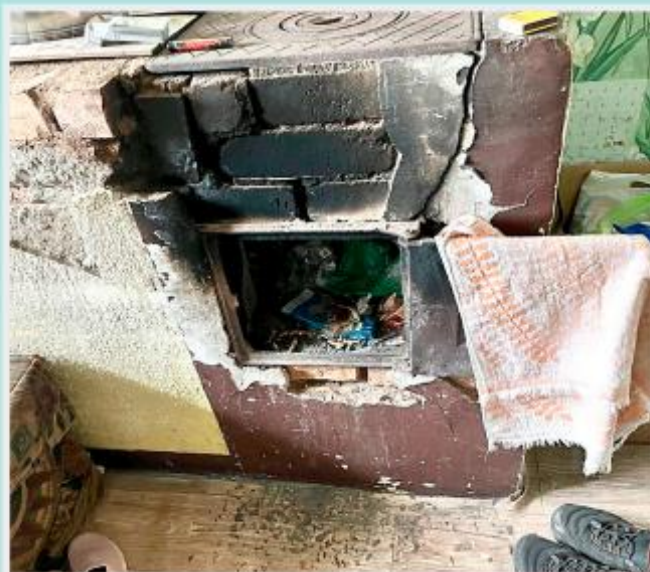
Отсутствует металлический (или из других негорючих материалов) предтопочный лист