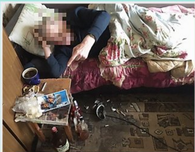
Допускается курение в кровати или ином месте для сна