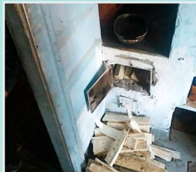
Запрещено размещать и хранить на предтопочном листе любые сгораемые материалы