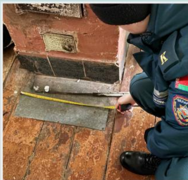
Размеры предтопочного листа менее чем 50 см (ширина) × 70 см (длина)