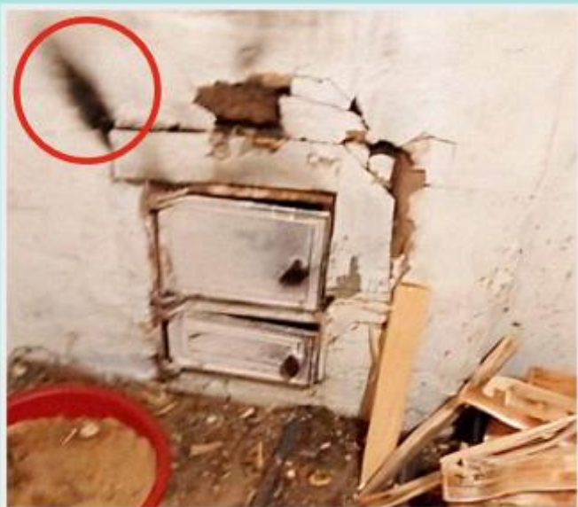
Имеются трещины в печи (место выхода продуктов горения топлива обозначено кругом)