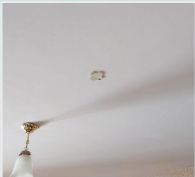
В жилых комнатах демонтированы автономные пожарные извещатели