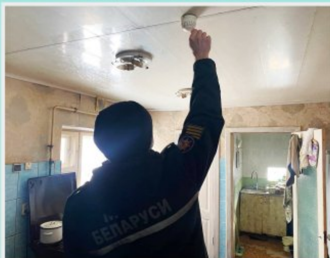
При нажатии на кнопку автономный пожарный извещатель не выдает звуковой сигнал (порекомендуйте заменить элемент питания типа Крона). Напомните о периодической очистке извещателя от пыли