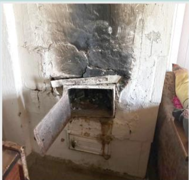
Топочная дверка печи не исправна (не закрывается или не фиксируется в закрытом состоянии)