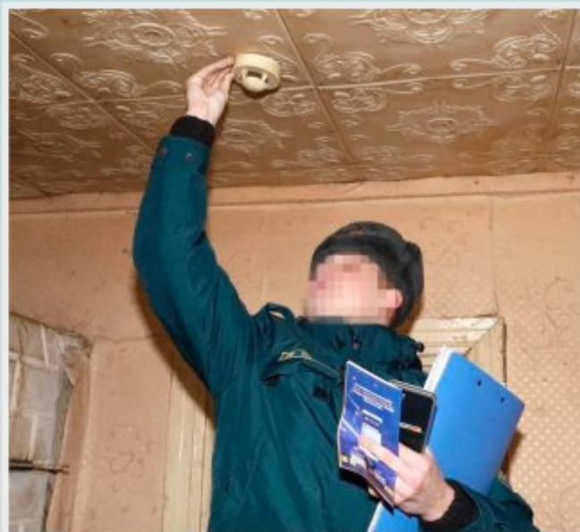
Предложите домовладельцу продемонстрировать (при наличии возможностей) исправность автономного пожарного извещателя

Министерство по чрезвычайным ситуациям Республики Беларусь